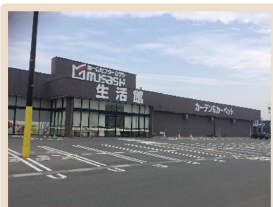
ホームセンタームサシ長野南店 1.1km