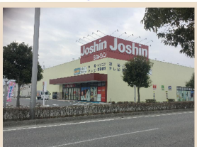
ジョーシン長野インター店 890m